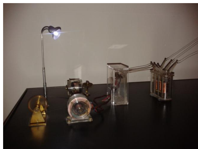
Prikaz transformatora i makete prenosa