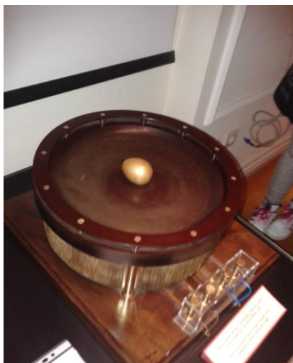
Čuveni ogled “Kolumbovo jaje“

Iz posete izdvajamo ono što je na nas ostavilo najjači utisak.