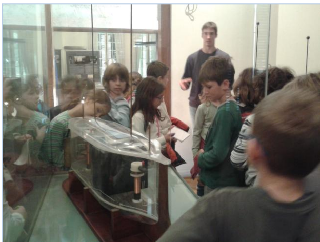
Prvi brod na daljinsko upravljanje