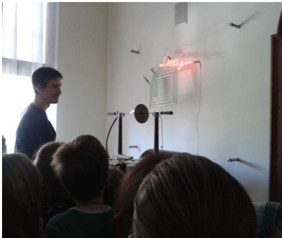
Način rada svetleće reklame