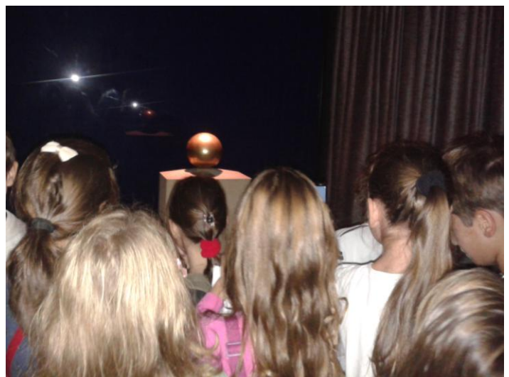
Posmrtni pepeo u kugli